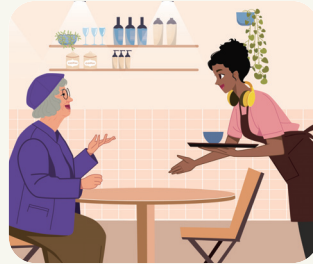
자주 가는 카페